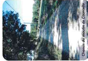
Chemin du moulin de Courcelle