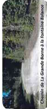
Chemin de La Grande Bonne à la fontaine Balance