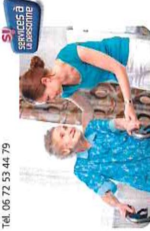
SI SERVICES à la personne

ASSOCIATION D'AIDE A LA PERSONNE (ADMIR) Tél. 06 72 53 44 79