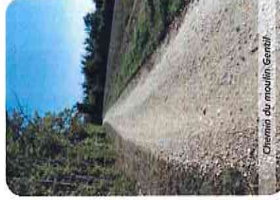
Chemin du moulin Gentil