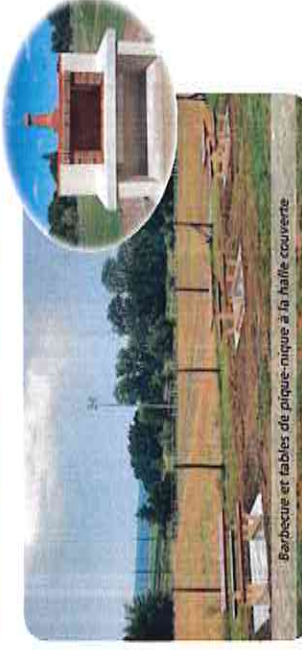
Barbecue et tables de pique-nique à la halle couverte