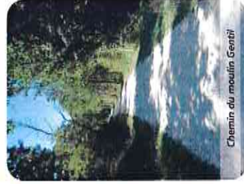
Chemin du moulin Gentil