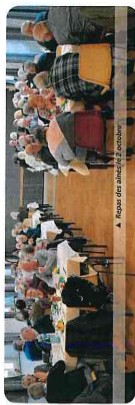
▲ Repas des aînés le 2 octobre