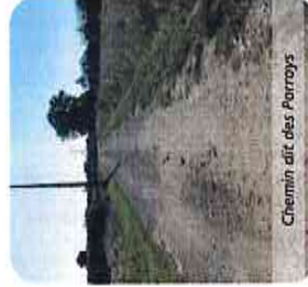
Chemin dit des Porroys