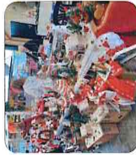
▲ Marché de Noël du 12 décembre 2021