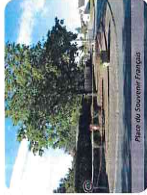
Place du Souvenir Français