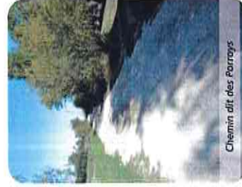
Chemin dit des Porroys