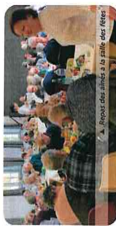
▲ Repas des aînés à la salle des fêtes

Le repas des aînés le dimanche 2 octobre 2022 Le repas des aînés a eu lieu à la salle des fêtes. 61 personnes ont eu le plaisir de se retrouver autour d'un repas préparé par le restaurant « Les Prés dans le Plat » : un moment de partage, de convivialité en ce bel après-midi apprécié de tous. A l'issue du repas, nous avons remis un sachet de douceurs confectionnées par la boulangerie O'Repere d'Ammaury et une décoration de table préparées par la commission sociale. Nos remerciements à Élodie et Rémy de la boulangerie « O' Repère d'Ammaury » et à Madeleine Piedallu pour la réalisation du pliage des serviettes de table.