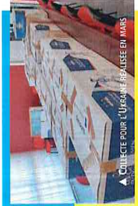
▲ COLLECTE POUR L'URINAIRE RÉALISÉE EN MARS 2022

Un homme engagé qui a laissé sa plaque au 2 rue de Belleville à Sury-près-Léré