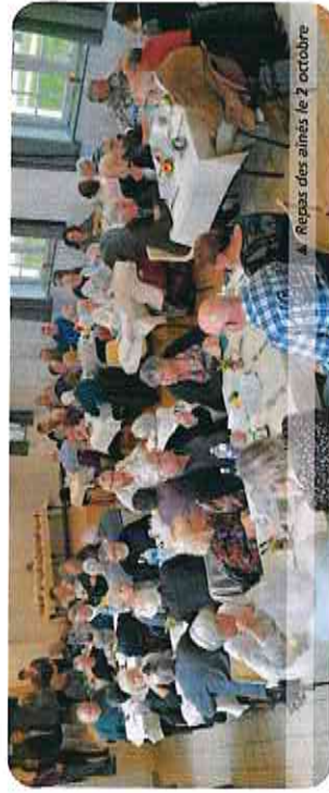
▲ Repas des aînés le 2 octobre