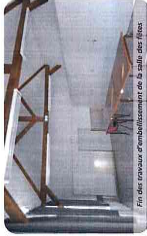
Fin des travaux d'embellissement de la salle des fêtes