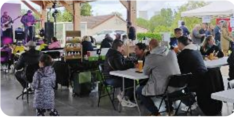
▲ Fête de la musique samedi 15 juin ▶