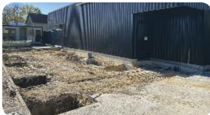
◀ Travaux d'extension de la partie production de la boulangerie ▶