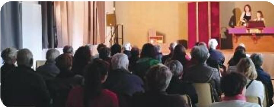
◀ Théâtre "Les Petites Cruautés"