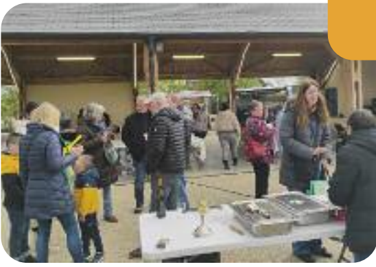
▲ Marché mensuel sous la halle ▶