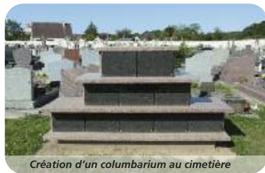
Création d'un columbarium au cimetière

Infos : La Balance présente une longueur de 12,7 km. Elle prend sa source à Savigny-en-Sancerre, traverse Sury-Près-Léré et Belleville-sur-Loire avant d'aller se jeter dans la Loire à Beaulieu-sur-Loire.