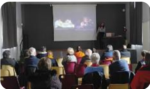
▲ Conférence à l'occasion de la Journée de la femme