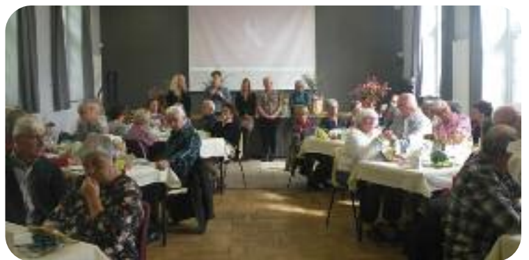
▲ Repas des aînés