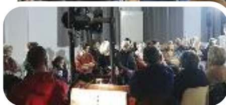
▲ Spectacle "Quichotte" ▼