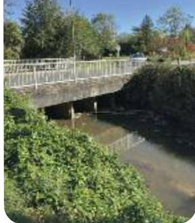
◀ Sous le pont, la Balance avant et après travaux de déblaiements de grande ampleur financés par le Conseil Départemental ▶