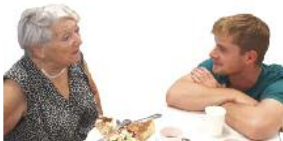
Une petite fille à Sury (Cf. articles p. 17 et 20)

Cette rentrée annonce de nouvelles étapes dans notre vie locale. Les actions perdurent et l'engagement pour de projets nouveaux fait plaisir à voir.