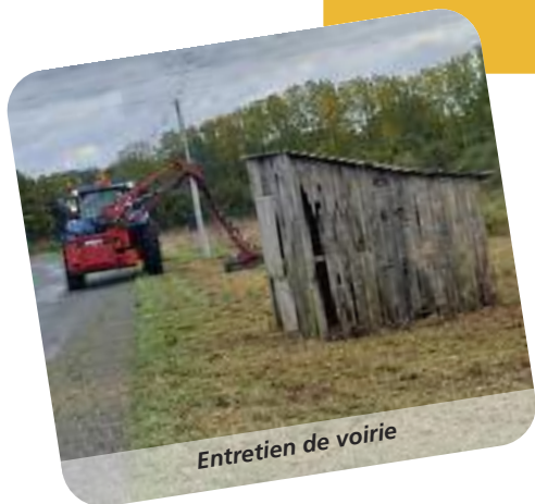
Entretien de voirie