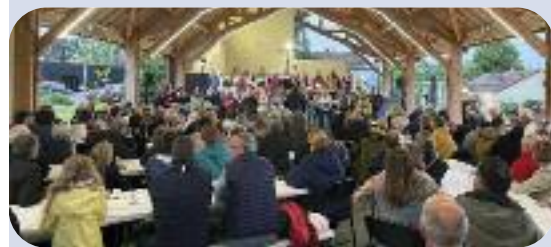
▲ Paëlla du 1er Juin • Concert du 1er février ▼