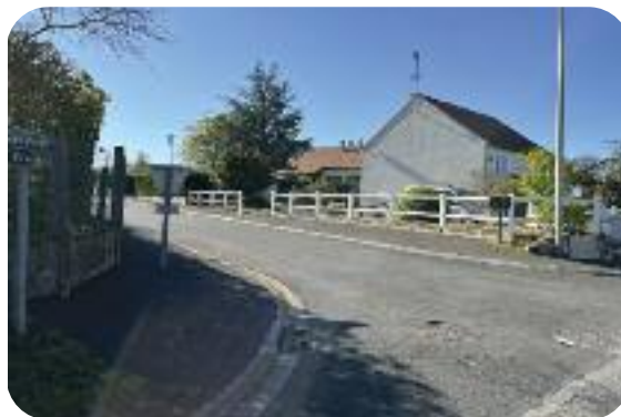
Réfection de la voirie rue des Petits Boulets