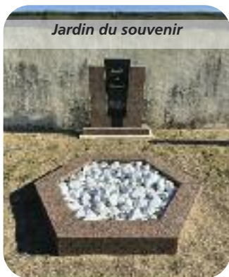
Jardin du souvenir