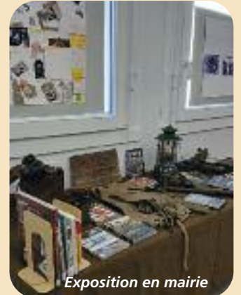
Exposition en mairie

Depuis la fin de l'année 2024, vous pouvez, en plus des livres et des DVD, emprunter des jeux de société pour petits et grands. Il vous est possible aussi de jouer sur place.