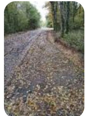
Chemin de Sainte-Anne ▲