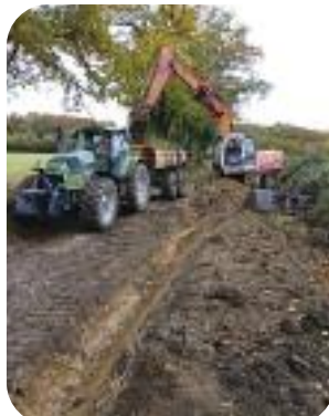
▲ Chemin des Bilassiers ▲