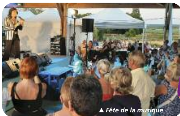
▲ Fête de la musique