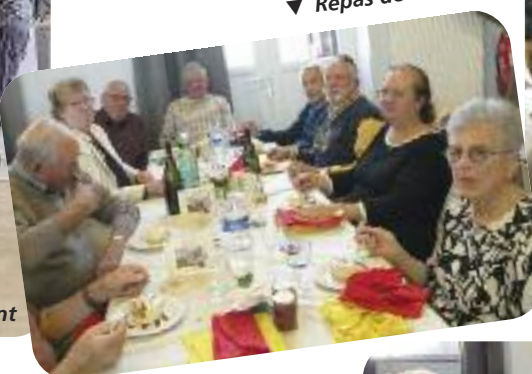
▼ Repas des aînés