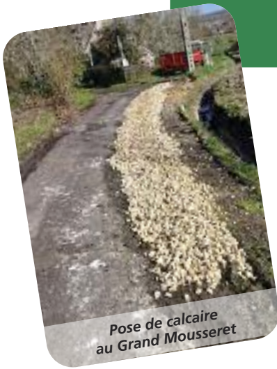
Pose de calcaire au Grand Mousseret