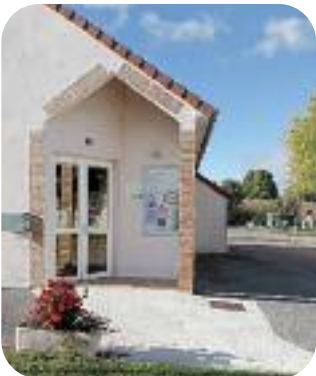
▲ Réalisation d'un accès han- dicapés à la Médiathèque