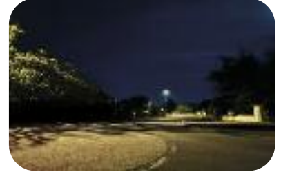
▲ Réfection des éclairages publics en LED