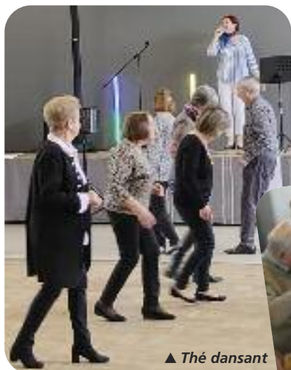
▲ Thé dansant