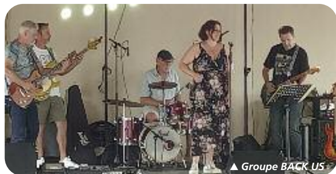
▲ Groupe BACK US