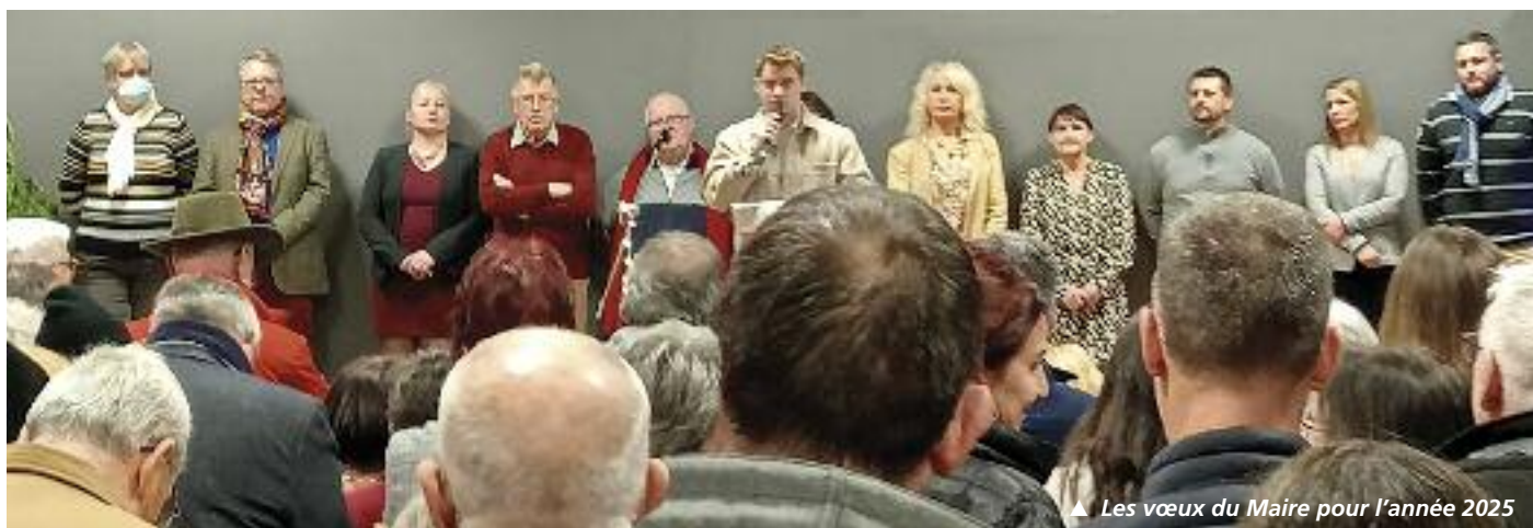
▲ Les vœux du Maire pour l'année 2025

Rendez-vous le vendredi 9 janvier 2026 à 18h30 à la salle des fêtes pour les vœux de la nouvelle année