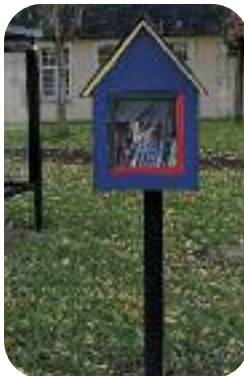
▲ Boîte à livres face à la mairie