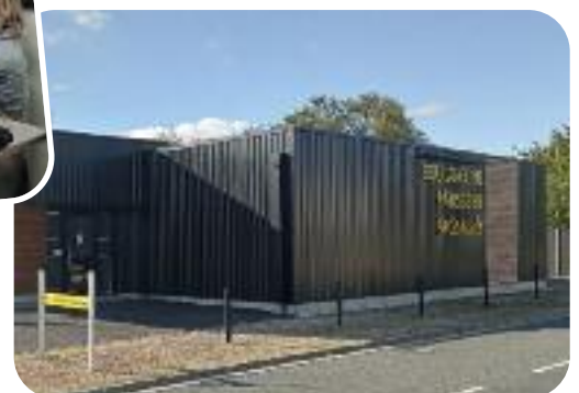
▲ Fin des travaux d'extension de la partie production de la boulangerie