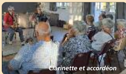
Clarinette et accordéon

La médiathèque accueille également les classes de l'école de Léré ainsi que les enfants de la section UEE de l'IME de Saint-Satur . Ces moments d'échange et de partage avec les enfants leur permettent de se familiariser avec les lieux ainsi qu'avec le livre à travers des lectures d'albums ou des tapis de lecture ou kamishibais. Ils peuvent également emprunter des documents.